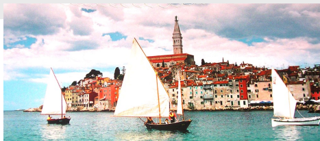
viš. Rajmund Kupareo

Čekamo samo da se ispune nad selom i nad nama riječi Tvojih "kantadura": "Kad bi pokopan Gospodin, grob se zapečati..."