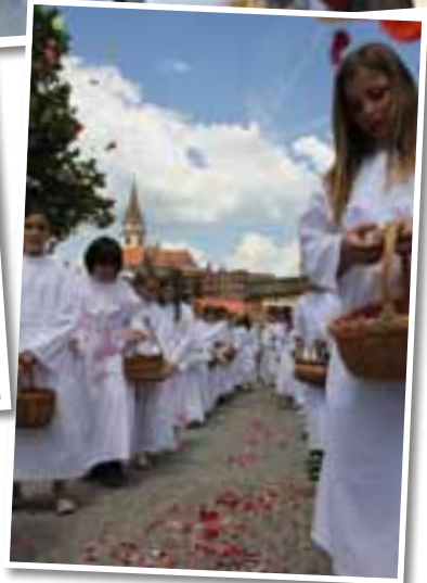
19. VI. – SVETKOVINA PRESVETOGA TIJELA I KRVI KRISTOVE, TIJELOVO