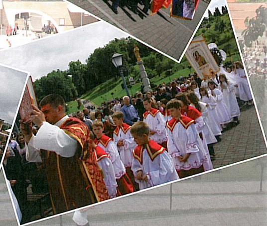
2010: Žalosni petak, Cvjetnica, Uskrs, Dječji vrtići, Hodočašće vatrogasaca, Duhovi, Tijelovo