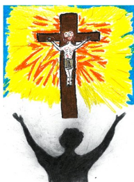
Gracija Galoić, Otkupljenje grijeha