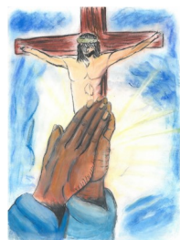
Matija Kovačić, Svjetlost na dlanu